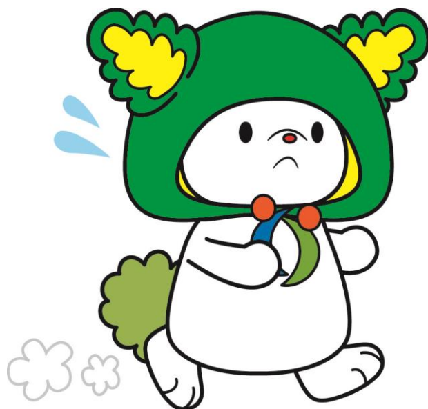
下川町イメージキャラクター「しもりん」