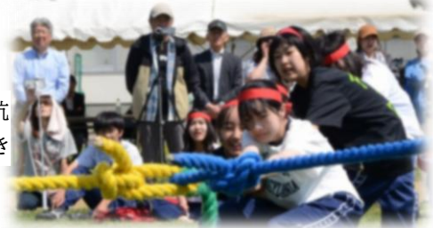
縦割り対抗 Y字綱引き