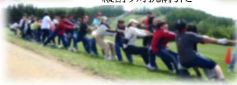
縦割り対抗綱引き