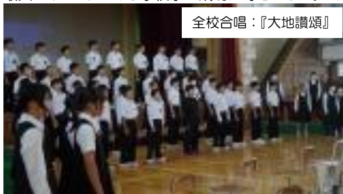
全校合唱：『大地讃頌』

今年のテーマは「Skip a Beat～青春はなりやまない～」。全校が一体となって楽しむ学校祭は大変素晴らしく、感動的でした。準備から本番までは短い期間でしたが、協力して取り組み、中学校で最大のイベントである学校祭を成功に導きました。こうした頑張りは今後の生活でも大いに生きるこ