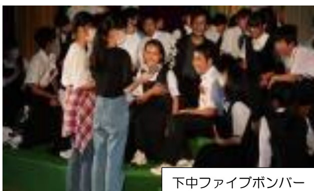
下中ファイブボンバー