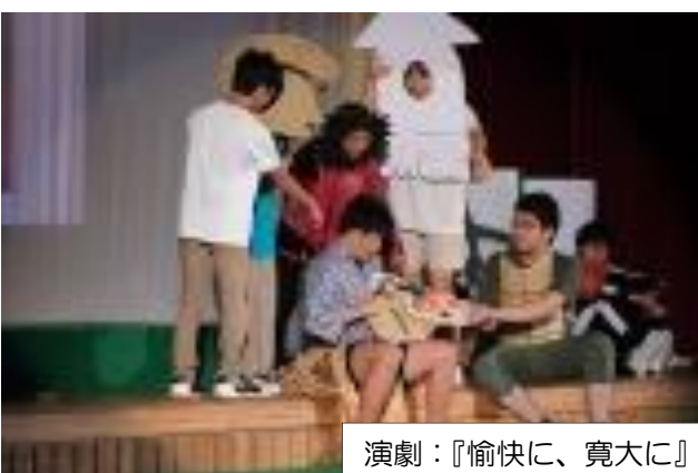
演劇：『愉快地に、寛大に』