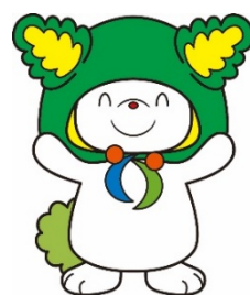
下川町イメージキャラクター 「しもりん」