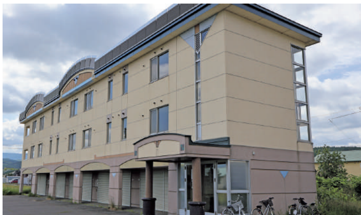
平成7年度建設日昇団地公営住宅1棟10戸

平成7年度建設の日昇団地1棟10戸の老朽化した給湯及び給排水管等の更新並びに車庫天井と断熱工事等の日昇団地公営住宅長寿命化型改善工事5,434万円の契約について、議会の議決を求めらるるものです。