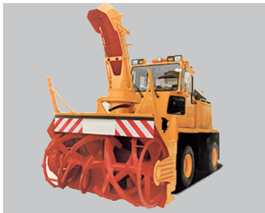
取得するロータリー除雪車

平成13年に取得した塵芥車（ごみ収集車）のシャフト部などの劣化に伴い、更新のため塵芥車一式1,892万円の取得について、議会の議決を求めらるるものです。