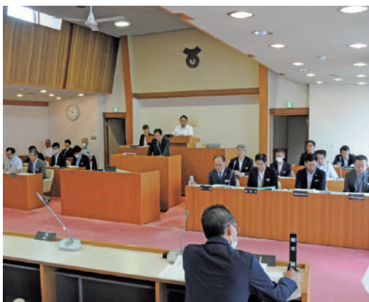
9月定例会議本会議の様子

また、2日目の14日は、一般質問を行い、3名の議員が町長の考え方などについて回答を求めました。