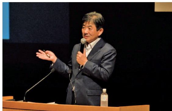
講演いただいた山崎内閣官房参与