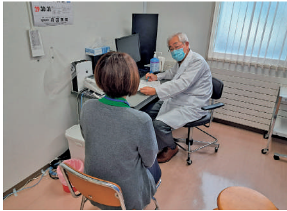
ワクチン接種の様子

また、資本的収入及び支出においては、名寄市立総合病院などと広域で受診者情報を共有する地域連携システムサーバーの仕入れ価格高騰などに伴い420万円を追加。