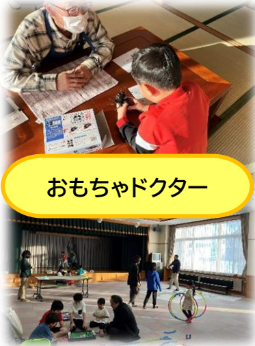
おもちゃドクター

困ったことがあった時に、支え合える家族のような人の輪を、町中に広げることが目標にかけ、「地域家族」を目指して活動をスタート！地域のみんなが、家族のように支え合えるには、まず「顔を合わせてお互いを知ること」が大事と考えいろいろなテーマで、子どもから高齢者まで、さまざまな世代の人が集まり・知り合い・つながる場として、「つながるカフェ」が誕生しました。