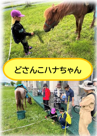
どさんこハナちゃん