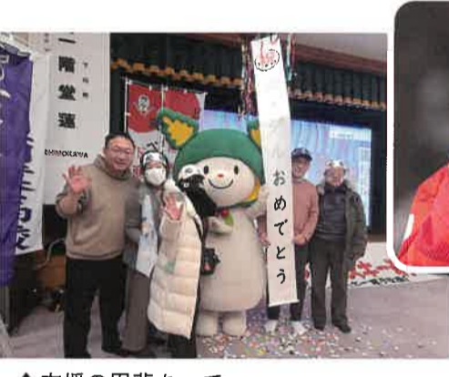
応援の甲斐あって