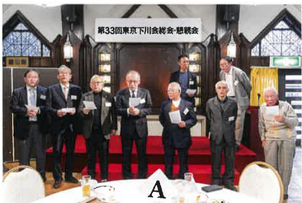
▲ともに歌う「ふるさと」。