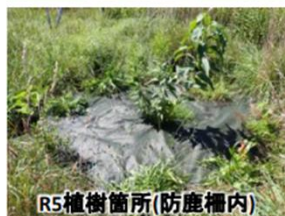
R5植樹箇所(防鹿柵内)

サンル川周辺に生育するオニグルミやハルニレ等の在来樹木から種子を採取してポット苗として育成し、皆さまと共に植樹をして森づくりを行っています。皆さまのご協力のもと、今までの植樹は2万本以上となりました。