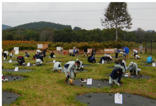
令和5年の植樹会の様子