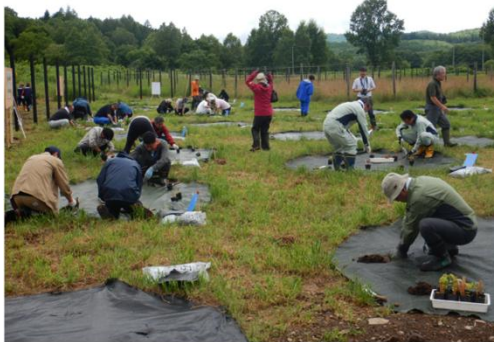
令和6年の植樹会の様子