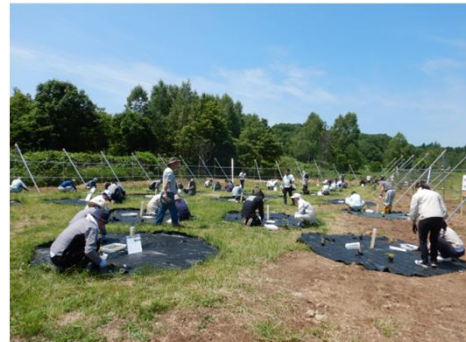
令和7年の植樹会の様子