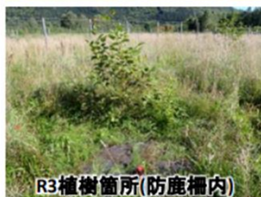
R3植樹箇所(防鹿柵内)