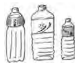
●ペットボトル ジュース・醤油など