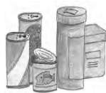
●空き缶 ジュース・缶詰など