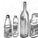
●空きビン ジュース・ドレッシングなど