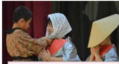
2年「群読（かさこじぞう）」