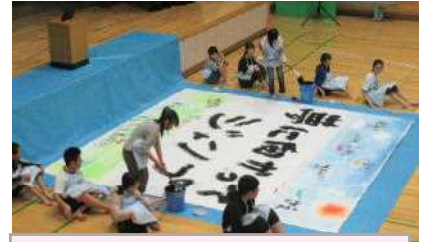
6年「夢に向かってジャンプ」