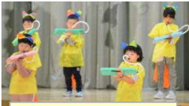
1年「かいじゅうのだいぼうけん」

10月15日（日）、多数の方にご来場いただき、学習発表会を実施することができました。写真で児童の活躍をお伝えします。