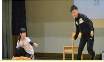
5年「なんだろう なんだろう」