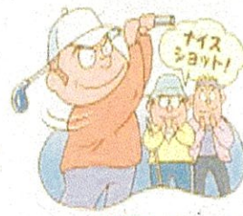
暴力団と「交際しない」