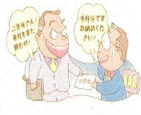
暴力団に「金を出さない」