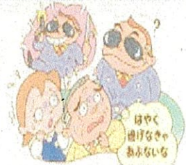
暴力団を「恐れない」