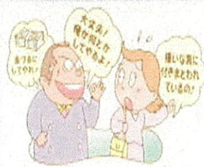
暴力団を「利用しない」