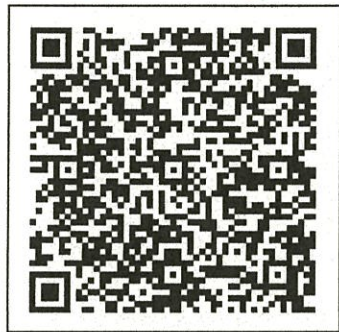
(飲酒運転ゼロボックス)

飲酒運転は、悲惨な交通事故を引き起こす悪質、危険な犯罪行為です。皆さん一人一人が「飲酒運転をしない、させない、許さない、そして見逃さない」ことを強く意識し、下川町全体で飲酒運転を根絶しましょう。 二日酔いでも運転してしまえば飲酒運転となり、気が付かずに飲酒運転を犯す可能性がありますので気を付けましょう。 北海道警察では、悪質な飲酒運転を根絶するため「飲酒運転ゼロボックス」によるタイムリーな飲酒運転の情報や飲酒運転根絶に向けたアイデアを受け付けています。 左記QRコードからアクセスできますので、ぜひ情報をお寄せ下さい。