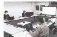
道路建設(株)のウェブ会議

さらに社内では「日常の移動が減った分、仕事に集中しやすい」という声もあり、社員の働きやすさの向上にも寄与していると思います。