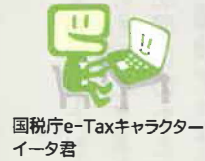
国税庁e-Taxキャラクターイータ君