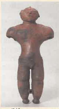
中空土偶(国宝)函館市縄文文化交流センター蔵

2020年1月、政府よりユネスコ(国連教育科学文化機関)に推薦書が提出され、現在はユネスコの諮問機関であるイコモス(国際記念物遺跡会議)の審査が行われています。道では引き続き、関係機関と連携し、北海道初の世界文化遺産登録の実現に向けて取り組んでいます。さらに、こうした取り組みを通じて「北海道の縄文」の価値に光を当て、地域に交流とにぎわいを創り出していくことを目指しています。