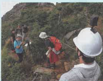
アポイ岳でのVR動画の撮影風景