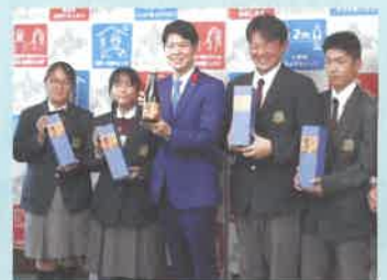
「忠」をPRする倶知安農業高校の生徒たち(2020年10月13日)

地域の産業や魅力を再発見し、将来の担い手づくりにつながる取り組みは、今後も継続の予定です。