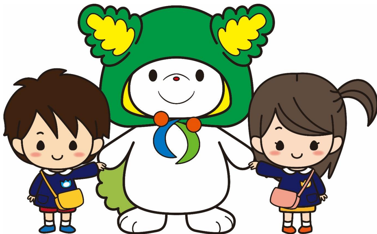
下川町イメージキャラクター「しもりん」