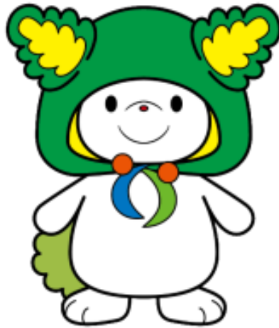
下川町イメージキャラクター 「しもりん」

下川町役場 総務企画課 総務係 〒 098-1206 上川郡下川町幸町63番地 TEL 01655-4-2511 (内線225) Mail s-shomu@town.shimokawa.hokkaido.jp