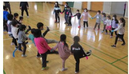
1年生と5年生「花いちもんめ」