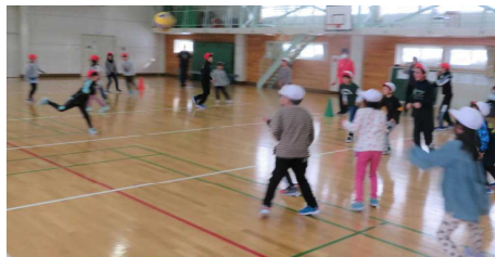
2年生と5年生「王様ドッジ」