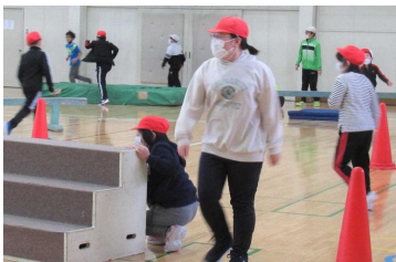
3年生と6年生「障害物こおりおに」

児童会の後期運営委員会が主催し、12月12日（月）～19日（月）の期間に下小まつりを実施しました。2つの学年が合同で交流して楽しむ企画です。上の学年が企画して、下の学年と一緒に楽しんでもらう形式で行いました。いくつか、写真で紹介いたします。なお、4年生の関わる交流についてはこの期間に欠席者が多かった関係で3学期に延期となっています。