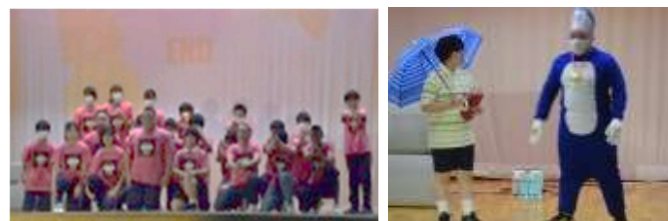
3年生「スタンドバイミー ドラえもん 2022」

貧困、飢餓・・・人類はこれまでにない課題に直面している。主人公達はどこへ向かったのか。