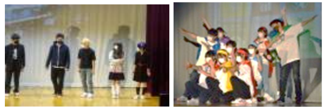
2年生「未来は僕らの手の中」

貧困、飢餓・・・人類はこれまでにない課題に直面している。主人公達はどこへ向かったのか。