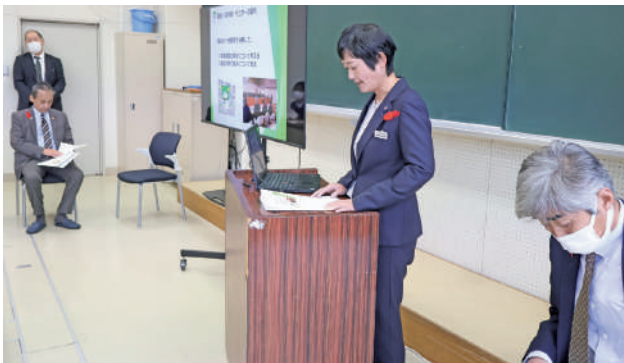
説明と寸劇を行う議員