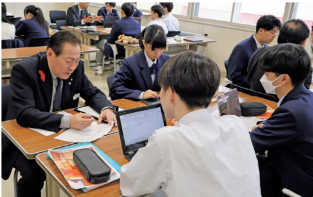
指導に熱が入る議員