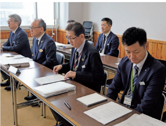
田村町長ほか 理事者見解

歯科診療所の早期誘致につい ては、町民からの期待も大きい ため、早期開業に向けて尽力 いただきたい。農業農村整備事業 を進めるにあたっては、農家と の合意形成を図りながら実情に 即した内容となることを期待す る。五味温泉については、経営 改善計画を着実に実行すること が肝要であり、町民の不安解消 と信頼回復に向けて町の指導・ 監督機能をより一層強化すべ きである。下川商業高等学校の存 続は、本町のまちづくりに大き な影響を及ぼすため、幅広い視 点での情報収集と発信に努め、 関係機関への働きかけの強化を 期待する。また、町内の遠距離 通学者に対する通学費助成の拡 充など更なる支援策も検討すべ きである。