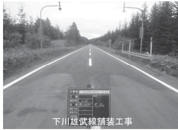
下川雄武線舗装工事