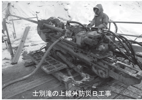
士別滝の上線外防災B工事