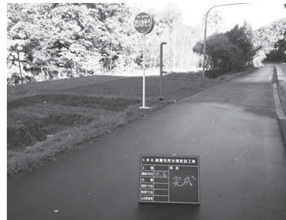
防火水槽設置工事