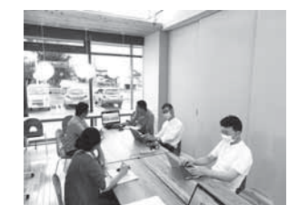
週1回のミーティングの様子