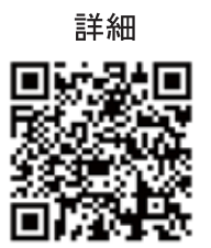
起業促進事業の内容