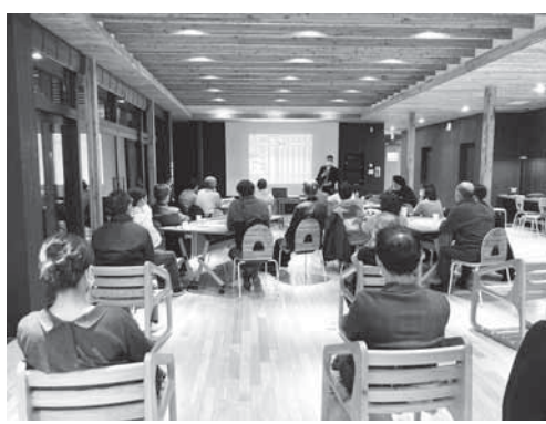
事業報告会の様子 (令和2年11月)

② 事業報告会の開催 事業進捗の説明や関わりをつくる機会を設けるため、活動報告会を開催し、シモカワベアーズが取り組みを発表しました。この様子はライブ配信され、オンラインと会場の合計で40名ほどの方にご参加いただきました。