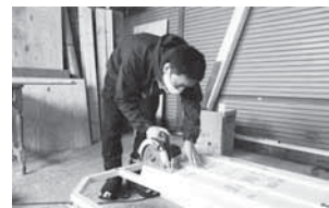
ベアーズの活動風景