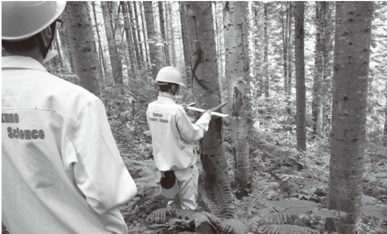
○標準地調査の様子

■お問い合わせ 農林課 ☎ 4 | 2511 内線 244 ☆ 4 | 251112