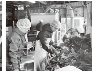
▲下川ふるさと興業協同組合