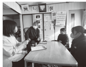
▲下川町役場保健福祉課