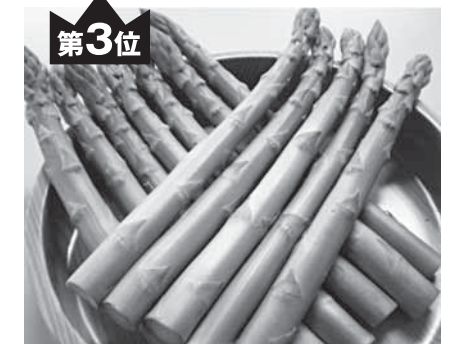
ホワイトアスパラガス2kg