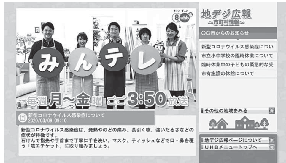
リモコンのボタン(例)

「地デジ広報」にて… UHB北海道文化放送が提供している地上デジタル放送を使った自治体情報提供サービスです。リモコンの「dボタン」を使って、町からのお知らせをご覧いただけます。