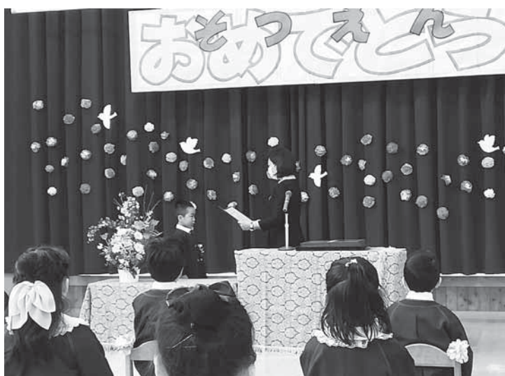
▲認定こども園 3月24日