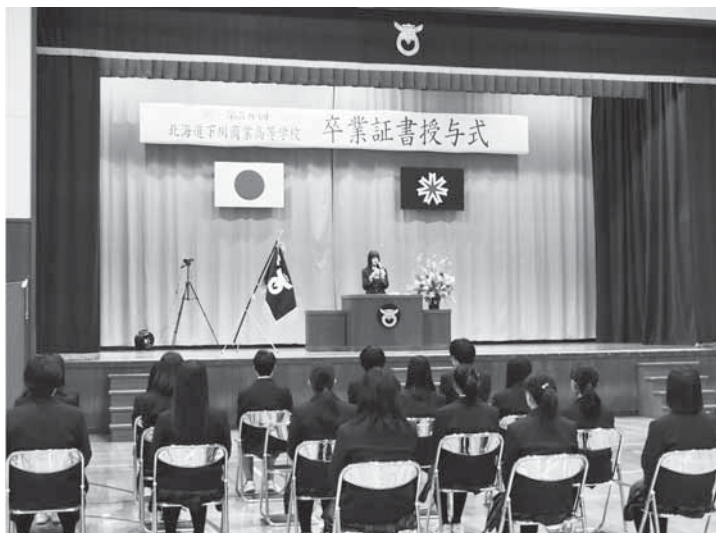
▲下川商業高等学校 3月1日