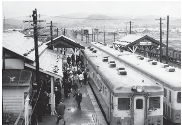
下川駅構内（昭和31年）