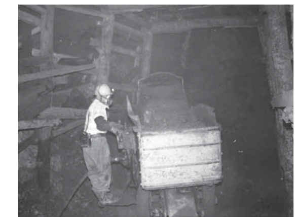
三菱下川鉱業所坑内（昭和50年頃）