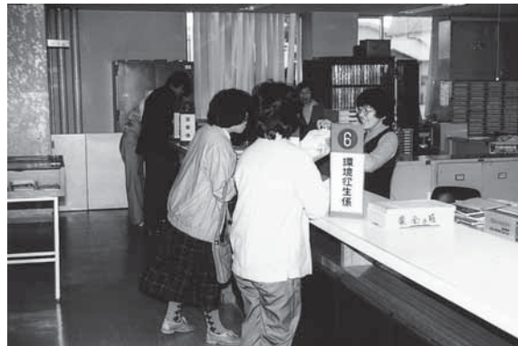
役場庁舎窓口（昭和49年）

町民の皆様には、町政に対しまして一層のご理解とご協力をお願いするとともに、ますますのご健勝、ご活躍を祈念して、開拓120年の節目にあたってのご挨拶といたします。