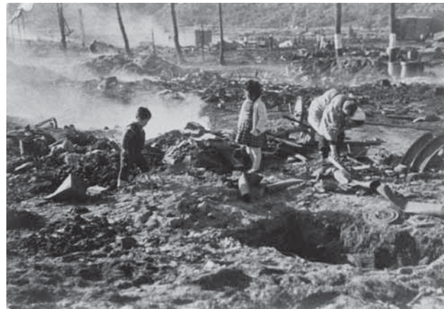
一の橋大火（昭和31年）