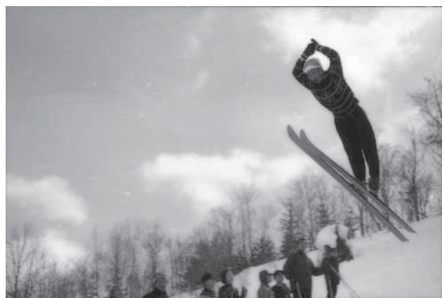
町民スキー大会（昭和36年）