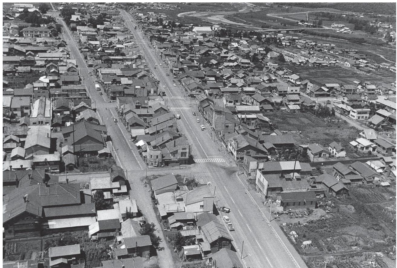
下川市街（昭和42年頃）