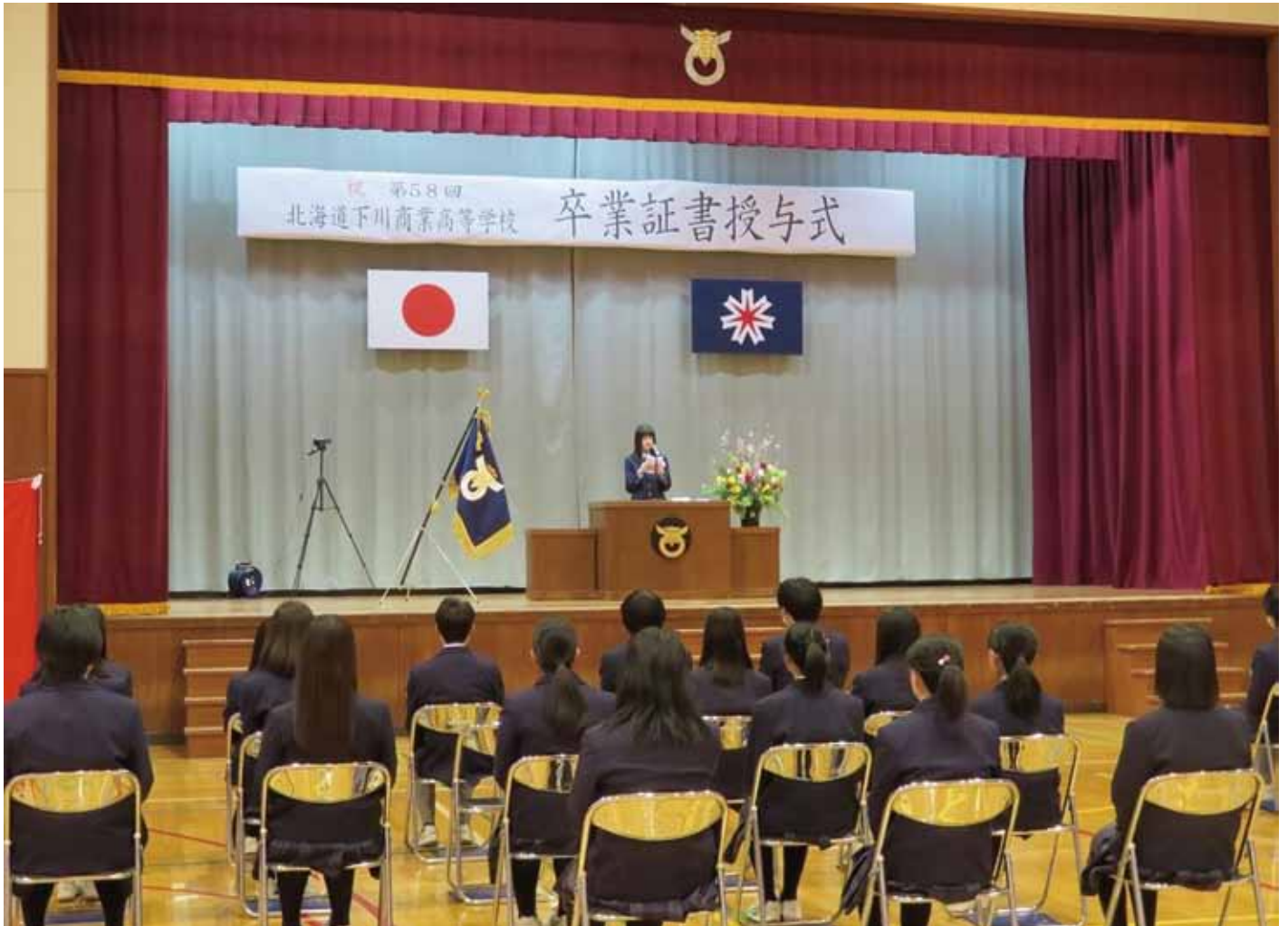
表紙 3月1日 下川商業高等学校卒業式より