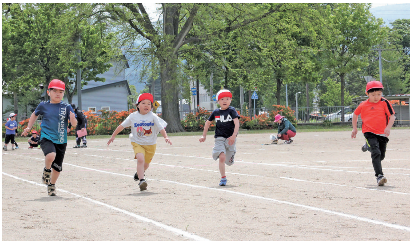
5月31日 下川小学校運動会 より