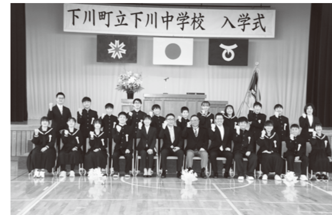
下川中学校 4月8日 17人