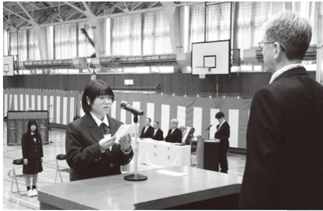
下川商業高等学校 4月9日 12人