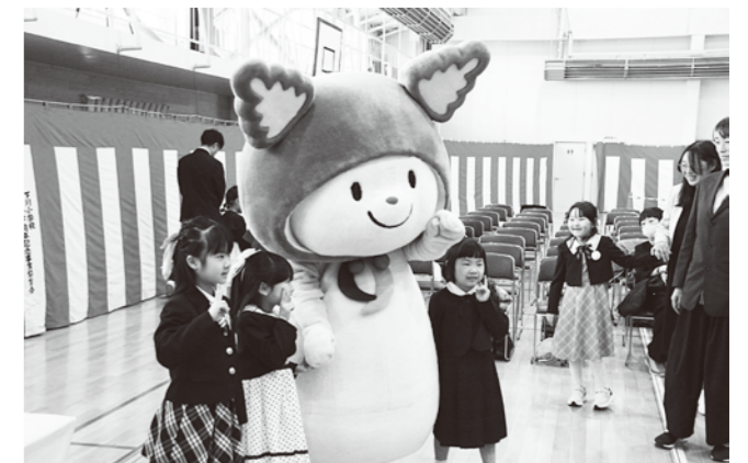
下川小学校 4月8日 16人