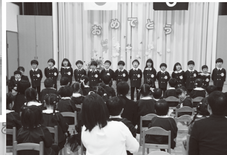
認定こども園 4月7日 4人